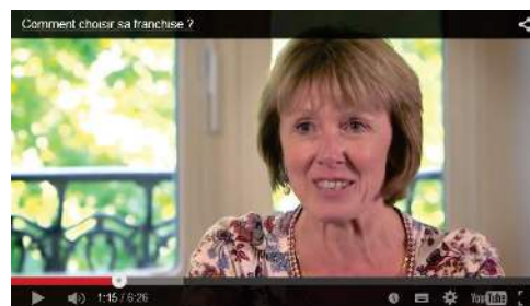
Vidéo « Comment choisir sa franchise ? »

Nous vous proposons de répondre à une série de questions qui vous permettront de faire une première évaluation de votre potentiel de créateur d'entreprise en franchise.